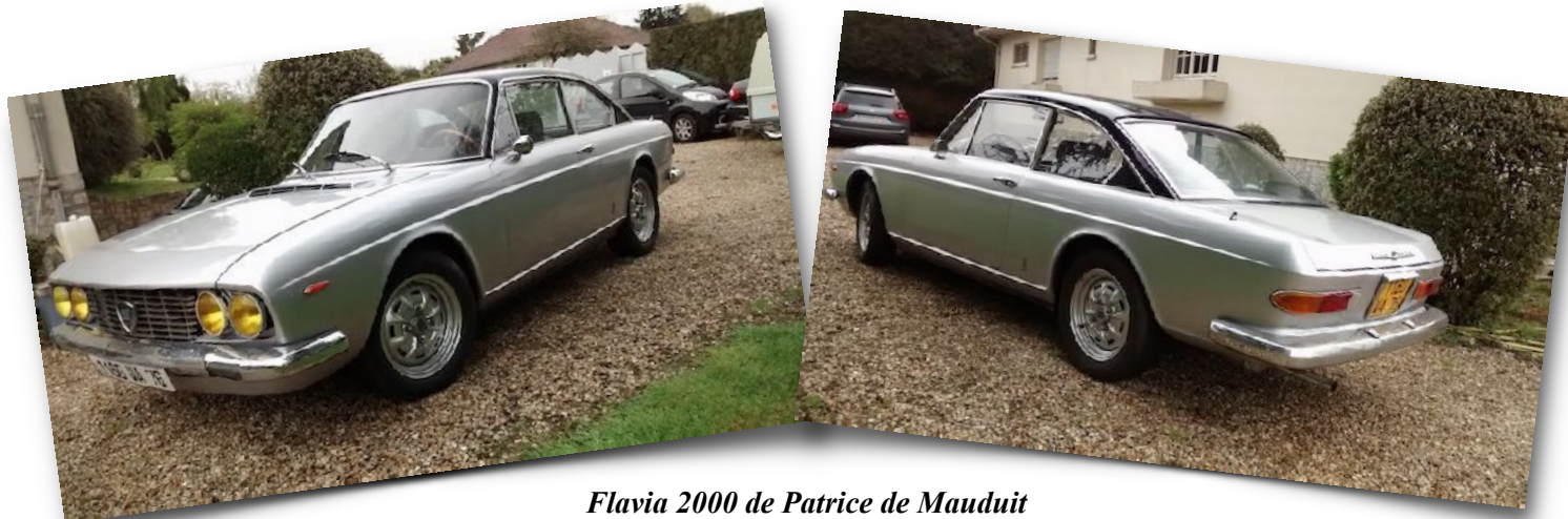
Flavia 2000 de Patrice de Mauduit